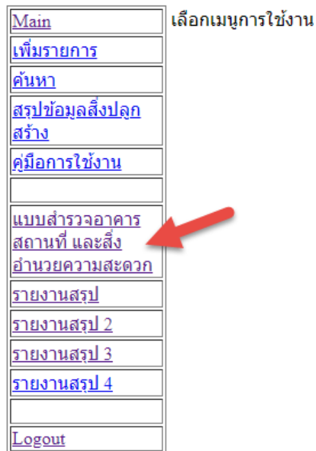
ภาพที่ ๓ แสดงหน้าจอหลักของหน่วยงาน

๓. เลือกเมนูการใช้งาน “แบบสำรวจอาคาร สถานที่ และสิ่งอำนวยความสะดวก