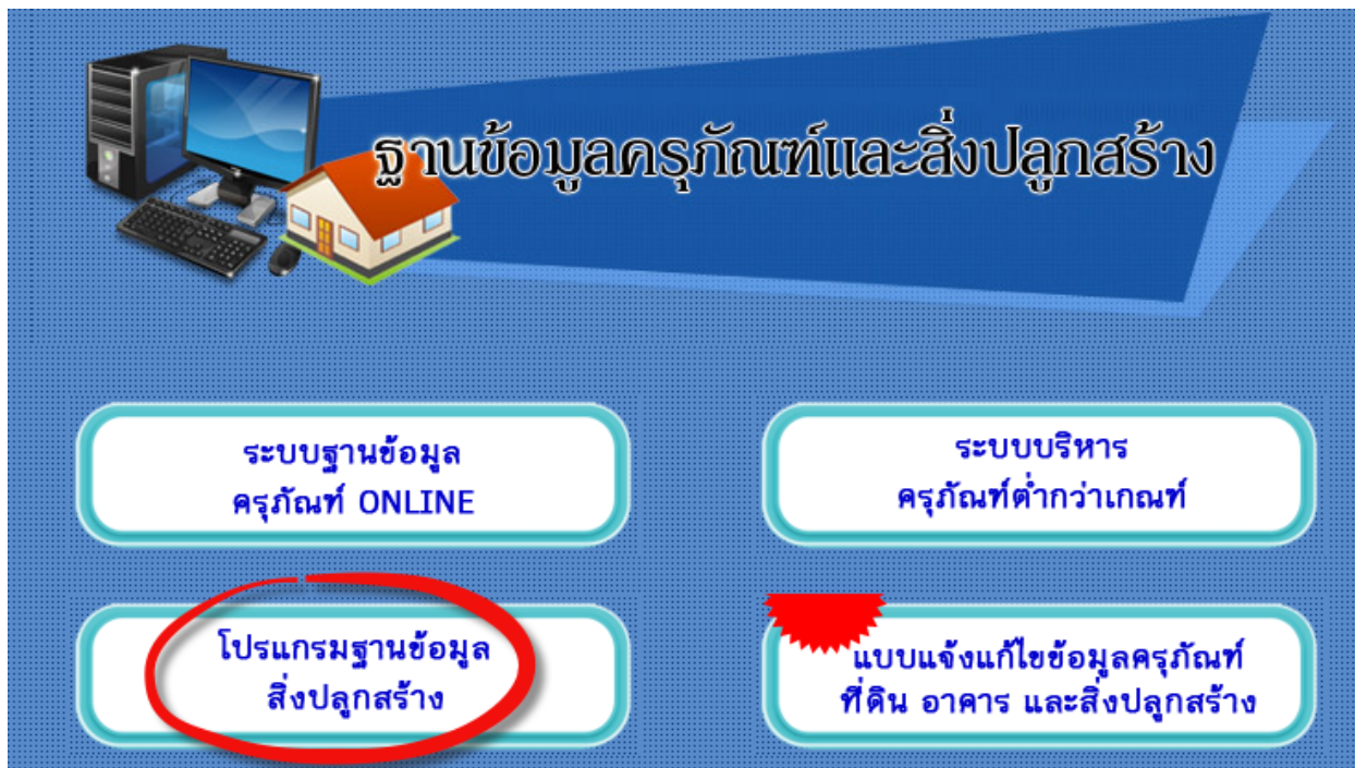
ภาพที่ ๑ หน้าเว็บไซต์ฐานข้อมูลครุภัณฑ์ และสิ่งปลูกสร้าง