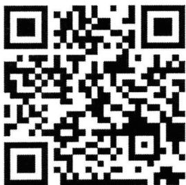
สิ่งที่ส่งมาด้วย ๕

คู่มือการปฏิบัติงานระบบเบิกจ่าย (Account Payable: AP)