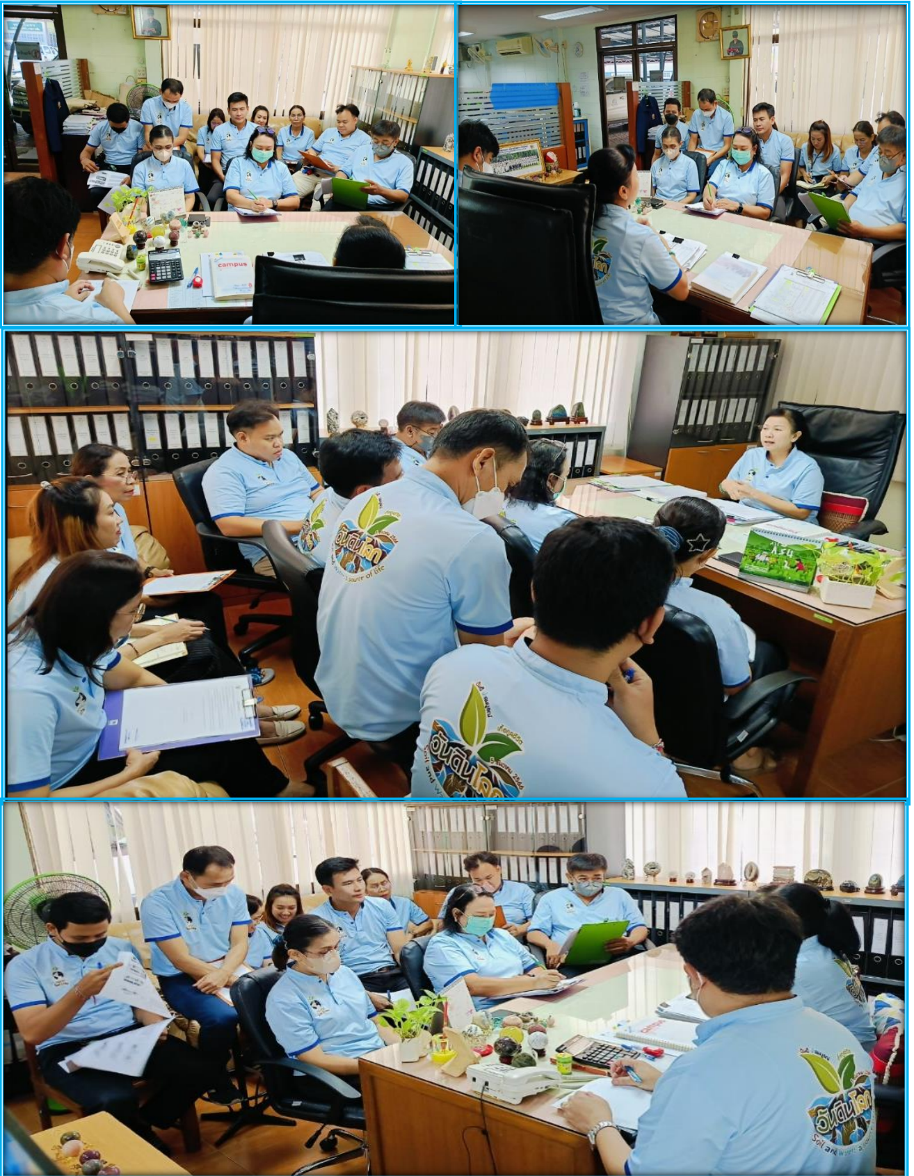
ภาพที่ ๑๓ รูปภาพการสอนงานของกลุ่มบริหารสินทรัพย์ กองคลัง